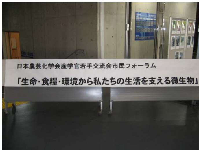
交流棟入り口にて