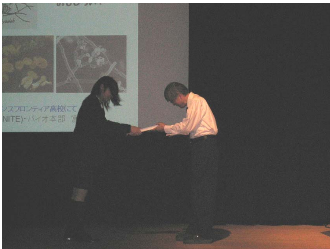
宮道先生著書の寄贈式の様子