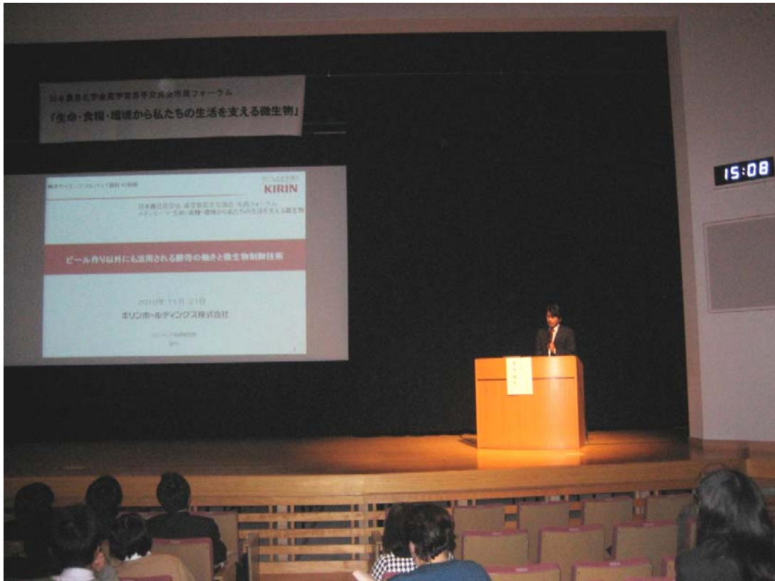
キリンホールディングス(株) 金内先生のご講演