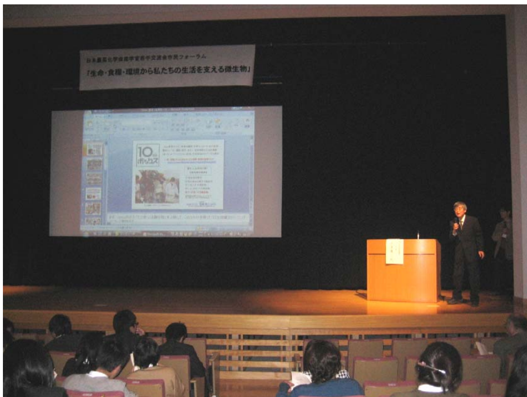
製品評価技術基盤機（元明治製菓㈱次席研究員）構宮道先生のご講演