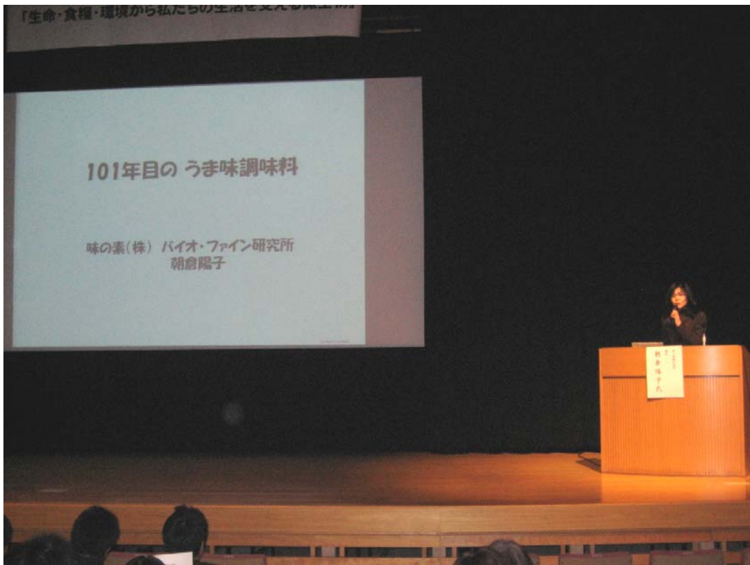
味の素(株) 朝倉先生のご講演